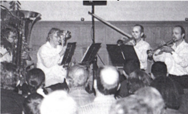
Das Bläserquartett als Einstimmung...