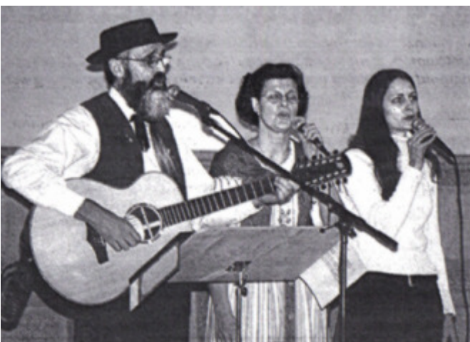
...und die Bündner Familie Schwarz als Stimmungszentrum. Hier in der Formation Eltern mit einer von vier Töchtern

Erwartungsfrohsinn allerorten, und was folgte, war die kommentierte Zukunft einer sehr persönlichen Geschichte. - Den Anwesenden gefiel's.